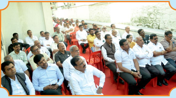
बँकेच्या मोबाईल बँकिंग ॲपचे उद्घाटनप्रसंगी उपस्थित मा. संचालक, सभासद, खातेदार.